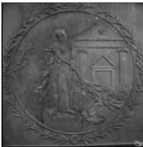
Abb. Gussplatte Friedrichshütte