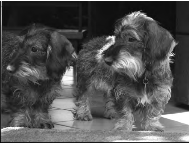
Abb. meine Dackel, die kleinen Jagdhelfer

Zwei Beispiele: 1. Stichwort: Aberglauben um Vi., H29-III, das heißt: Heft 29 III. Abschnitt, oder Stichwort: Zigeunerbande, H13-S7 = Heft 13 Seite 7