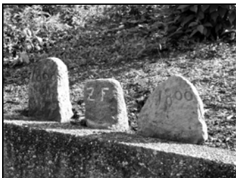
Abb. alte Grenzsteine, jetzt beim DGH